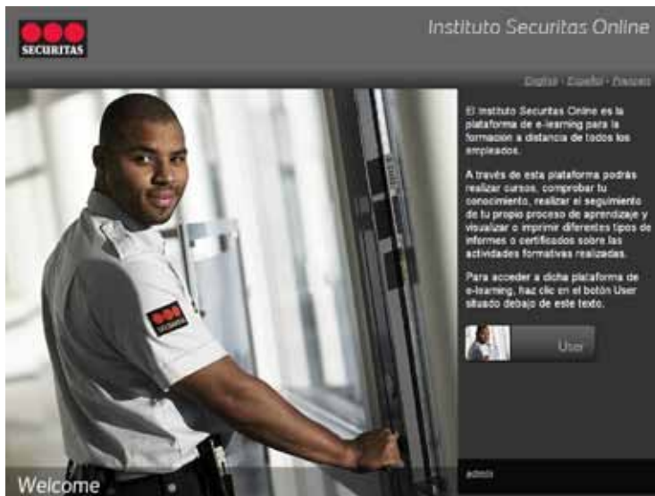
Portal de acceso al Instituto Securitas on-line